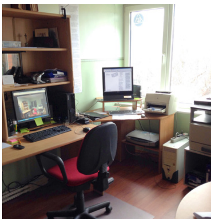
... и после.