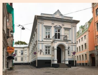
Mazā Pils iela 2, Katoļu baznīcas sanāksmju nams, Vecrīga.